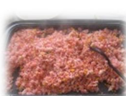
ケチャップ ライス お好み焼き風 チャーハン