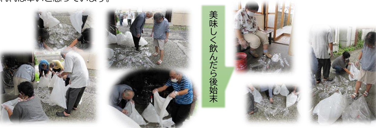
美味しく飲んだら後始末

利用者さんから出されたペットボトルがいっぱいになったら、潰してリサイクルに出します。環境整備とリサイクル意識が育まれば幸いです。