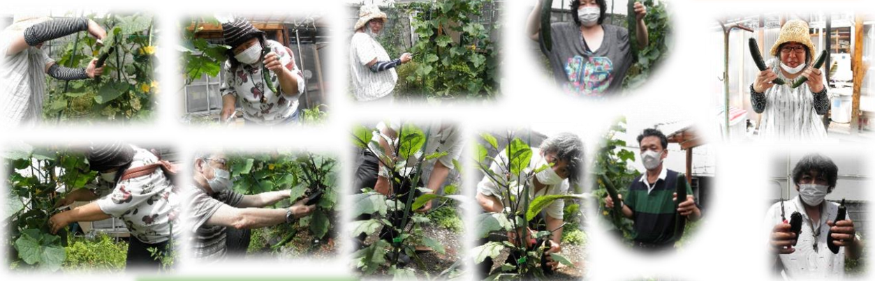
こうやって採るんだヨ