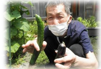
マスクに隠されたこの満面の笑み

ついにこの日がやってきました、見よ!?この満面の笑みを!! ということで、今日は、楽しい収穫です。キュウリにナスと… 恰好や大きさなんて気にしない、気にしない。 「食べれば、みんな同じだべ!?’と誰かさんのお言葉。 後日おいしくいただきました。