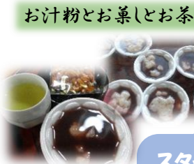
お汁粉とお菓とお茶